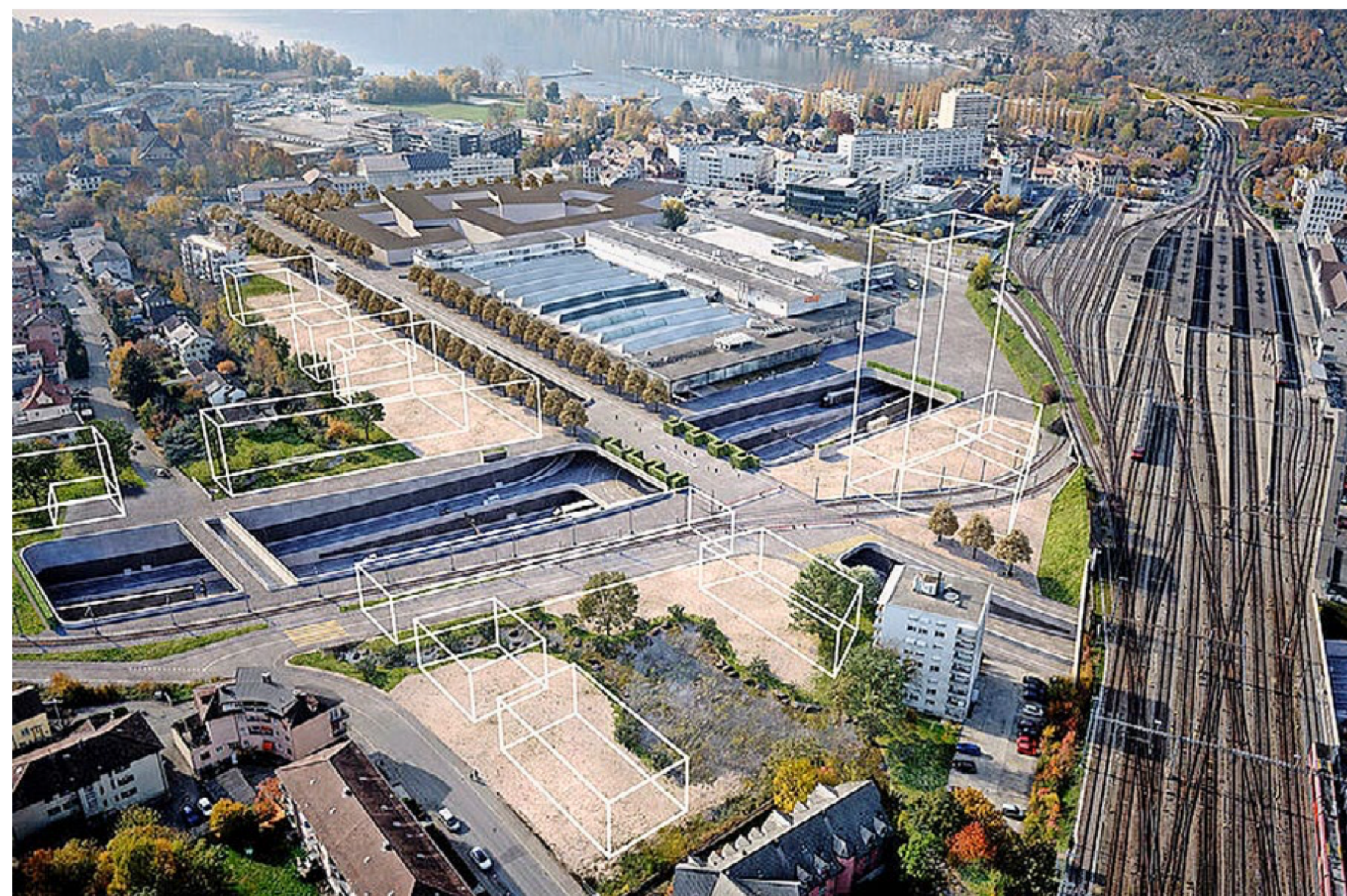
Visualisierung des offenen Autobahnanschlusses Bienne-Centre hinter dem Bahnhof mit möglichen Neubauten (weiss).

Damit sie ihre Pläne umsetzen kann, braucht die Stadt das entsprechende Land. Dieses wird jetzt für den Autobahnbau vom Kanton aufgekauft oder im Notfall enteignet. Nach Abschluss der Bauarbeiten werden dann jedoch zahlreiche Parzellen wieder frei. Die Stadt will sich diese Terrains im grossen Stil und zu einem möglichst günstigen Preis sichern. Vom Kanton verlangt sie Vorkaufsrechte für die entsprechenden Grundstücke. Und sie erwartet: «Der Erwerbspreis hat sich am Preis zu orientieren, den der Kanton für das Terrain bezahlt hat, beziehungsweise nach dem Wert, wie er sich nach enteignungsrechtlichen Grundsätzen ergibt.» Die Kosten für den Abbruch bestehender Liegenschaften oder die Umlage von Werkleitungen müssten Bund und Kan-